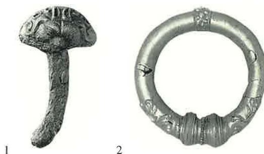
1 GOUVILLE D'ESSIEU

Sporen van Gallische bewoning in onze gewesten zijn schaars, fragmentair en zelden spectaculair. Vandaar dat een muntschat als die van Thuin van uitzonderlijk archeologisch en numismatisch belang is.