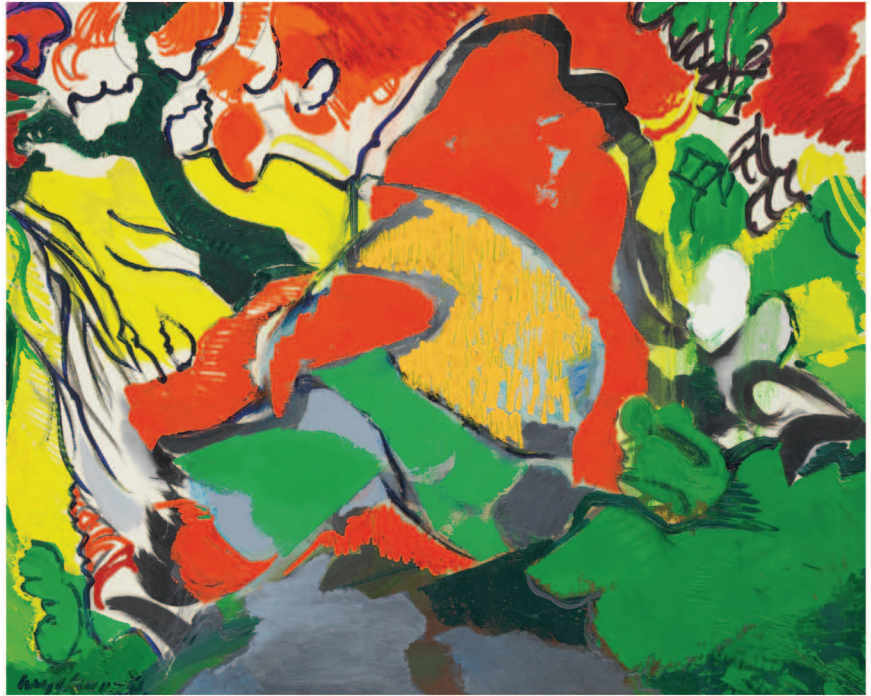
Maurice Wyckaert, Japanese Cherry tree, 1976 Don, 2004, BAM, Mons