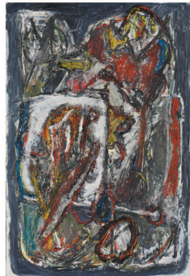
Jacques Doucet, Invitation à la nuit, 1979

Don, 2004, BAM, Mons